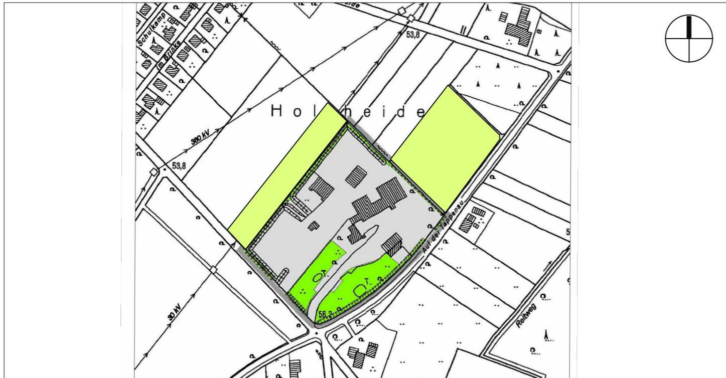
Rechtswirksamer FNP der Stadt Petershagen (Stand: 25. Änderung)