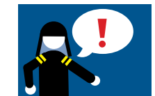
7. Auf Anweisungen achten