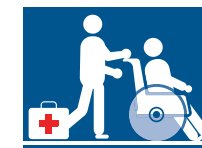
2. Hilflöse Personen mitnehmen und Erste Hilfe leisten