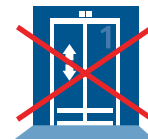
5. Keine Aufzüge benutzen

Können Räume nicht mehr verlassen werden, die Türen schließen und alle brennbaren Materialien von den Fenstern bemerkbar machen und auf Rettung durch die Feuerwehr warten.