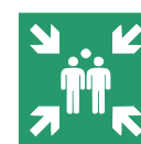
6. Sammelstelle aufsuchen